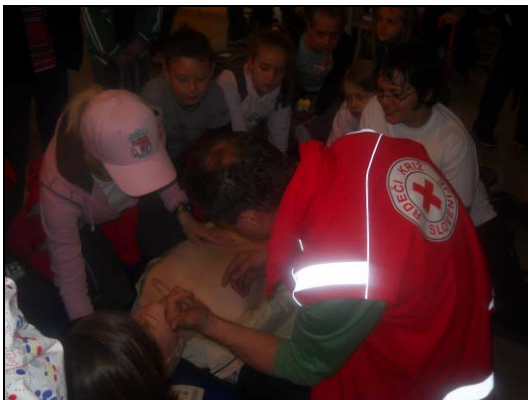
Pozorno poslušanje navodil oživljanja ponesrečenca.