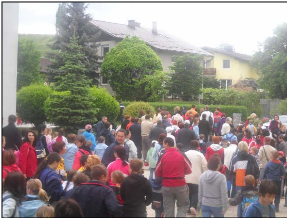
Vsi pogledi zazrti v nebo: »Bo dež, ali ne bo«?