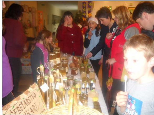
» Mmmm, kako je slasten ta med«!